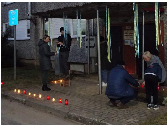
Akcija "Par Ukrainu! Par brīvību! Karam-nē!" 2.03