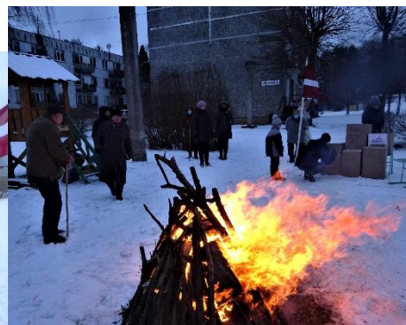
Barikāžu uguns kurs. Čaklāko lasītāju sveikšana 20.01